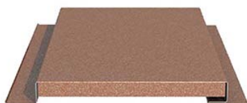
PRIMERANEL-T-G-24XC/20 (С ЗАКРЫТЫМИ ТОРЦАМИ) от 804 руб.