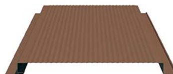
PRIMERANEL-O-B-24XC/20 (С ОТКРЫТЫМИ ТОРЦАМИ) от 784 руб.