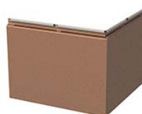
УГЛОВАЯ от 1050 руб.