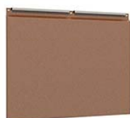
ПРЯМОУГОЛЬНАЯ от 1050 руб.