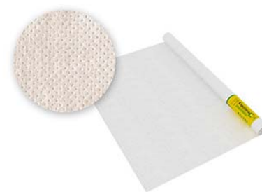
Optima C Гидро-пароизоляция универсальная 70м2