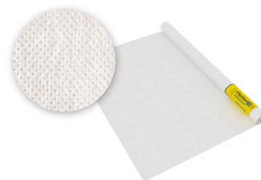
Optima B пароизоляция 35м2