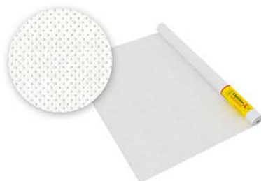
Optima A ветро-влагозащита 70м2