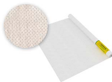
Optima C Гидро-пароизоляция универсальная 35м2