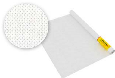
Optima A ветро-влагозащита 35м2