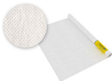
Optima D пароизоляция 70м2