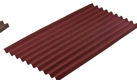
Лист кровельный битумный волнистый GUTTA (Красный) 2000*910мм (1.66 м2)