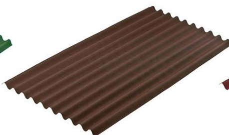
Лист кровельный битумный волнистый GUTTA (Коричневый) 2000*910мм (1.66 м2)