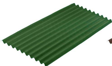
Лист кровельный битумный волнистый GUTTA (Зеленый) 2000*910мм (1.66 м2)