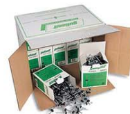
Гвозди ЕРШ оцинкованные 2.8 * 70 мм