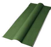
Конек ГУТТАНИТ с металлической окантовкой 1050*450мм