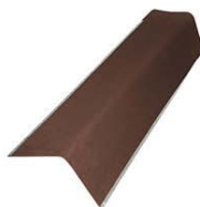
Фронтон с металлической окантовкой 1050*150*150мм