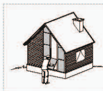
УТЕПЛЕНИЕ ФАСАДА ПОД САЙДИНГ

* Расширенный ассортимент базальтового утеплителя Hotrock Вент Лайт включает плиты толщиной от 50 – 200 мм с шагом в 10 мм.